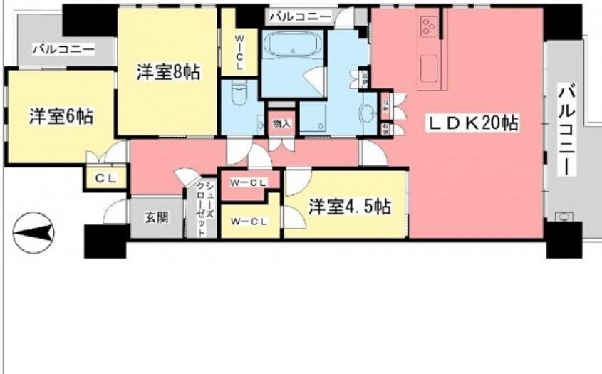
間取図が現状と異なる場合、現状を優先します。